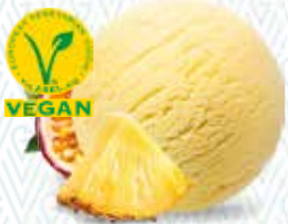
Passionsfrucht/ Ananas Sorbet